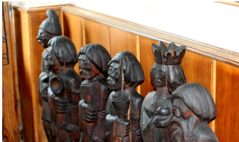
MUSEO DELL'ARTE DEL LEGNO CAMPULUNG MOLDOVENESC