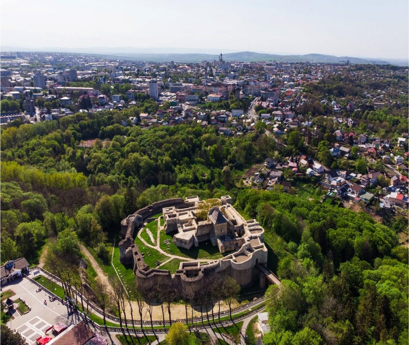
CITTÀ DI SUCEAVA