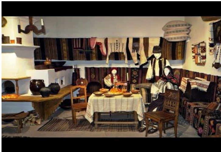
MUSEO DELLE TRADIZIONI POPOLARI - GURA HUMORULUI