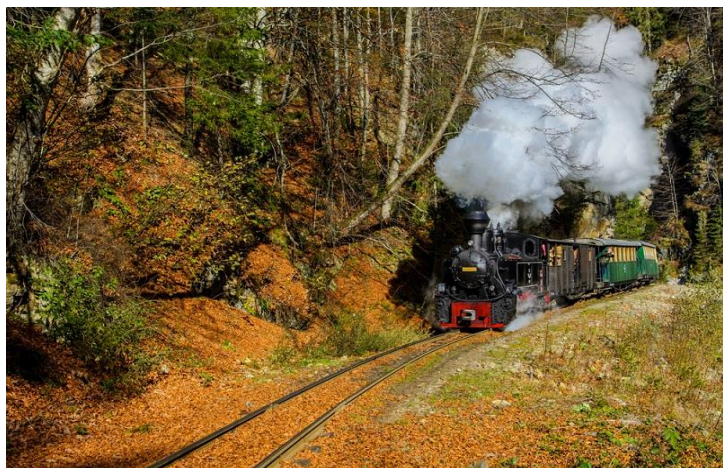
TRENO TURISTICO MOCANITA

MOLDOVITA – CAMPULUNG MOLDOVENESC – VATRA DORNEI