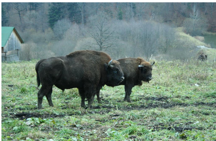
BISONTI NEL PARCO NATURALE DI VANATORI NEAMT