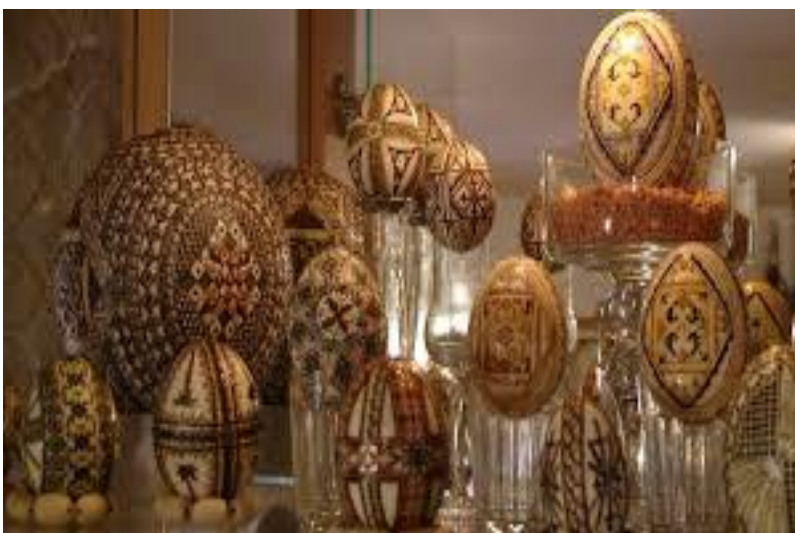
MUSEO DELLE UOVA DIPINTE

Ore 08,00 – Colazione in hotel in zona Gura Humorului