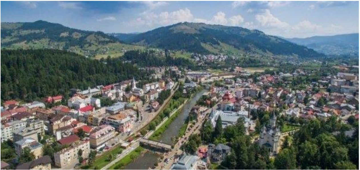
CITTÀ DI VATRA DORNEI