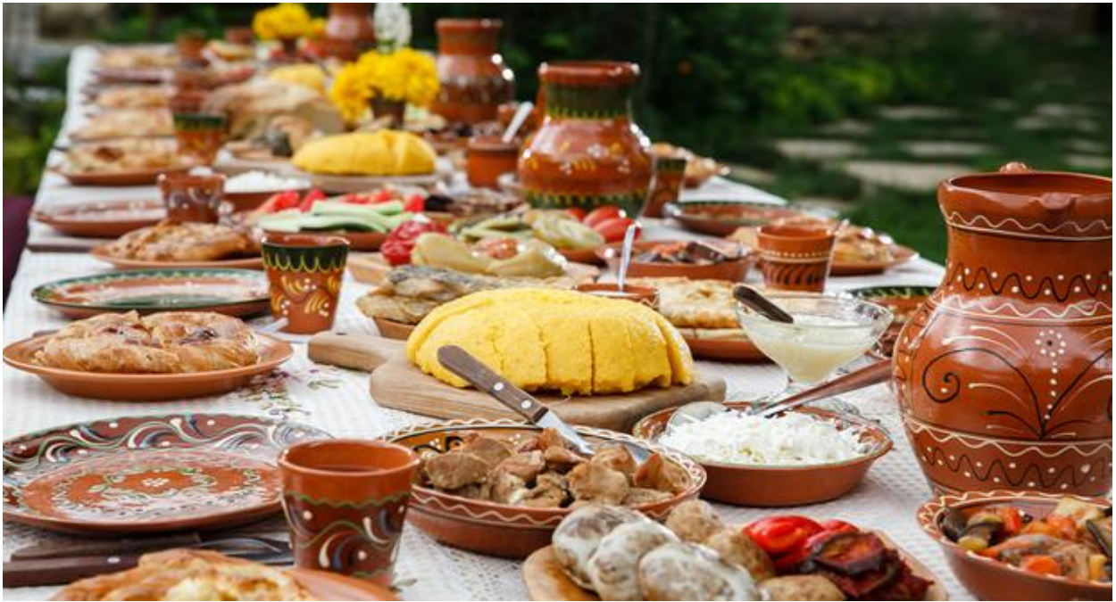
CIBI TRADIZIONALI ROMENI