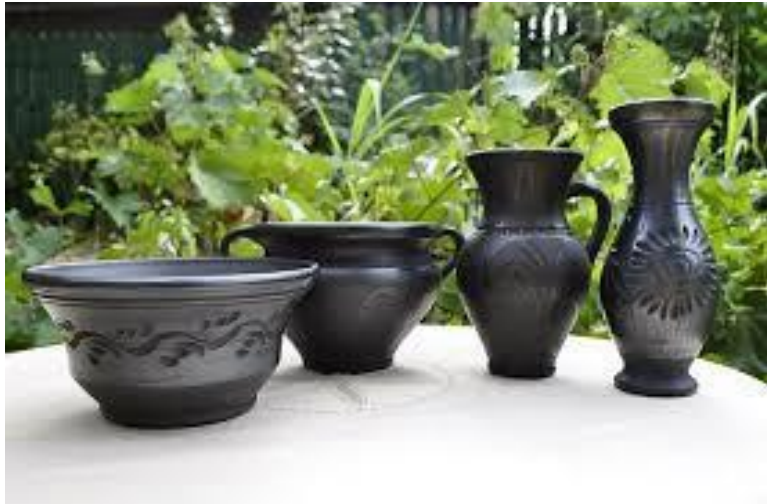
CERAMICA DI MARGINEA