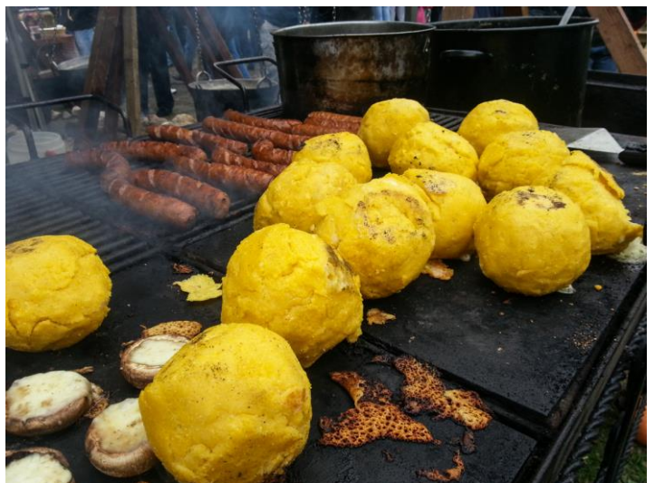
STREET FOOD IN BUCOVINA