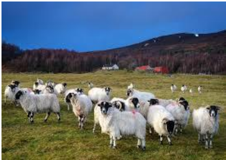
PECORE AL PASCOLO IN LIBERTÀ