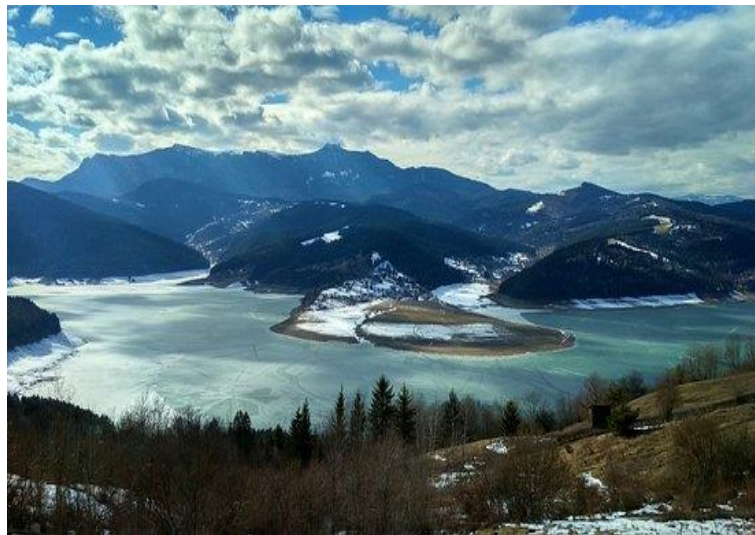
IL LAGO "IZVORUL MUNTELUI"